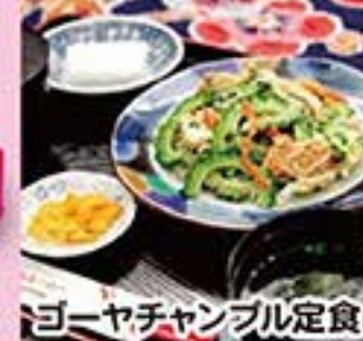
ゴーヤチャンプル定食