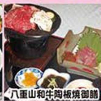
八重山和牛陶板焼御膳

30万年の時間が創り上げた天然記念物指定の大鍾乳洞「玉泉洞」(石垣島鍾乳洞跡地)。その地下100mに湧き出るカルシウムとミネラルが豊富な天然水を磨き上げ造られたCORAL-WATER 100%のビール。 ※アルト、ケルシュ、IPA、ブラックエールの4種類。インターナショナルビアカップ受賞! おみやげにも、オススメ!