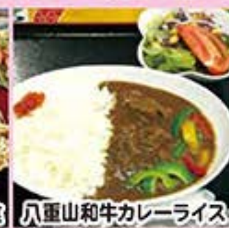
八重山和牛カレーライス