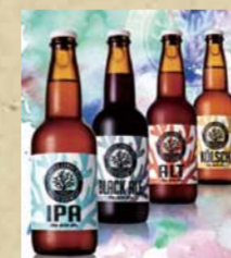
◎ OKINAWA SANGO BEER