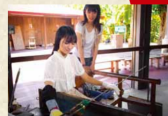
■ 琉球玻璃工房(王國村區域)

琉球王朝時代中，只有王族、士族才能穿著的傳統服裝。採用沖繩自然、鮮豔的色彩，華麗的色調魅力無限。除了色彩、模樣之外，還有提供花笠等飾品。男士和兒童服裝的選擇也很豐富哦。