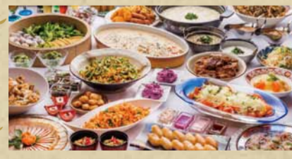
■ 健康自助餐 CHURA島

健康自助餐講究使用沖繩食材，有新鮮的當地蔬菜、香草、近海魚等。常備80種以上的美食，提倡「健身益心」的飲食概念。兒童間、和室座位設備完善，讓攜帶小朋友的家長也可以安心利用。還有提供無障礙空間。