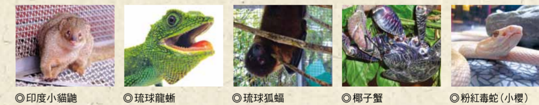
◎ 印度小貓鼬 ◎ 琉球龍蜥 ◎ 琉球狐蝠 ◎ 椰子蟹 ◎ 粉紅毒蛇(小櫻)